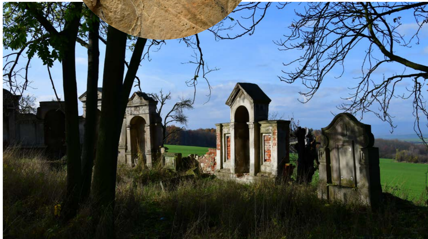
Fotografie jsou pouze ilustrační

Statisíci korun už přispěl Liberecký kraj na obnovu starého farního hřbitova v Kamenickém Šenově, o který se už patnáct let starají členové spolku Sonow, který se věnuje restaurování náhrobků a hřbitovní zdi. Výše částky, kterou kraj věnoval, činí 620 tisíc korun; jen letos to bylo 60 tisíc na záchranu hrobky Jakoba Kromera.