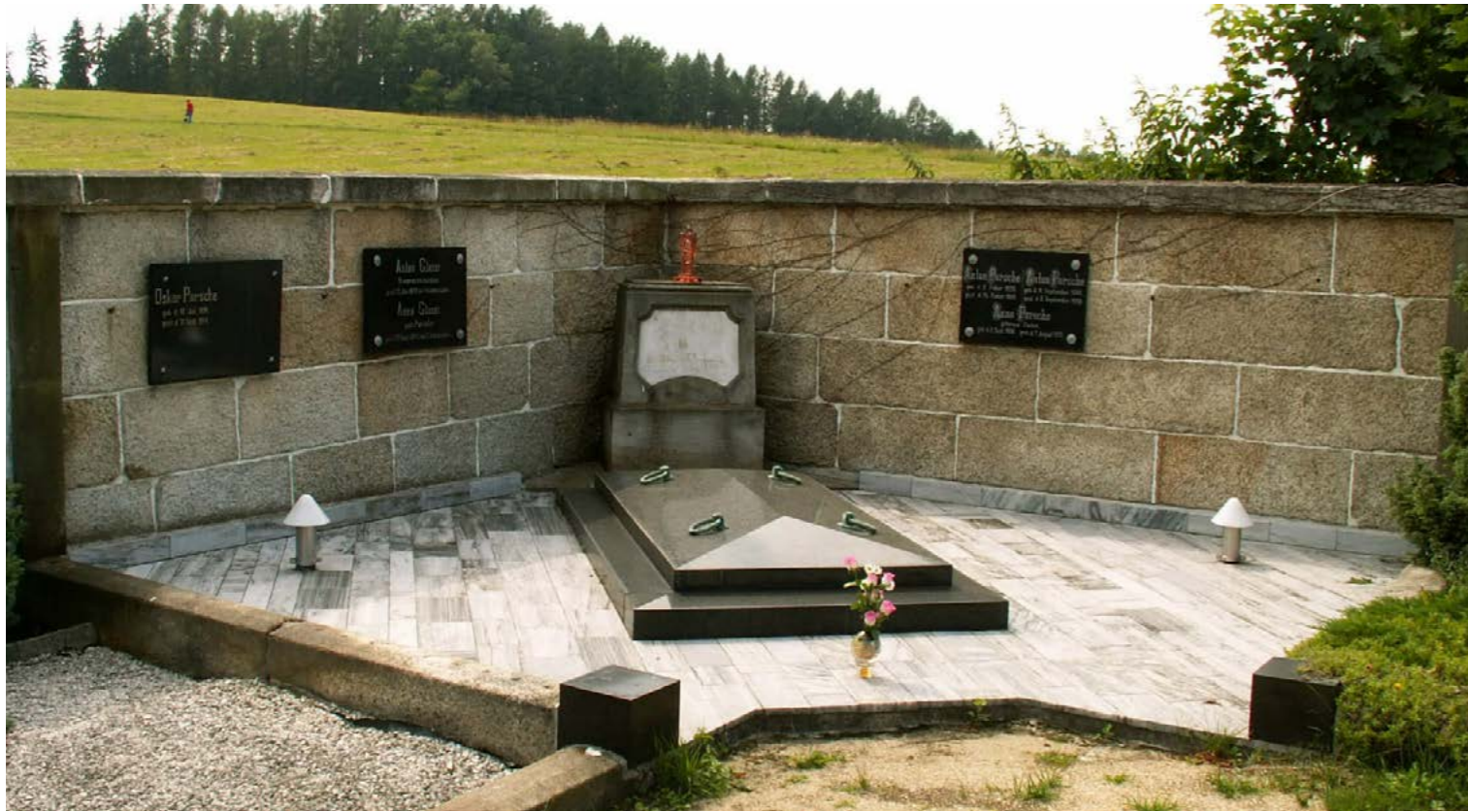
Hrobka rodiny Porsche

Ruší hrobku slavné rodiny Porsche nechceme, mírní debatu starosta Vratislavic